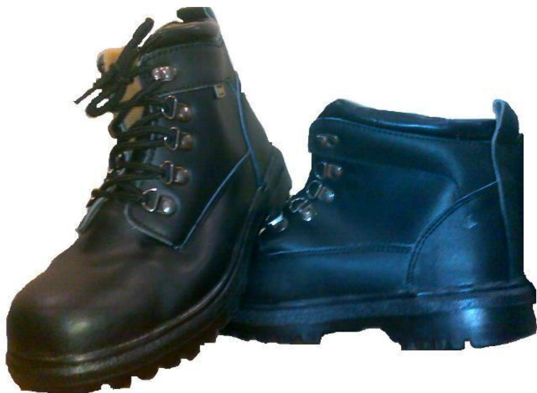
Ботинки Ранг 1500 тенге