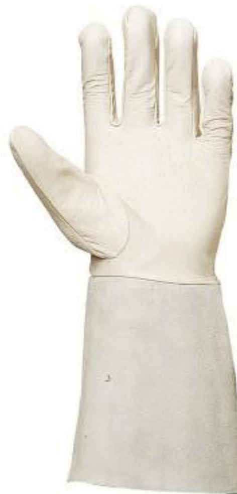
Краги аргонные 600тг