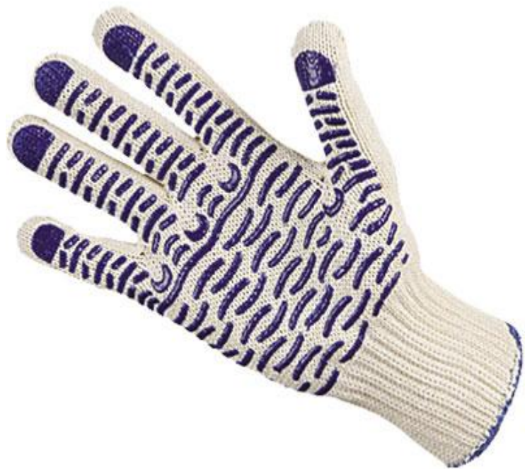
Перчатки трикотажные с ПВХ «Люкс-Волна» 75тг