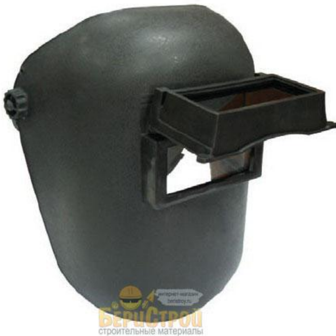
Маска Сварщика 600 тг