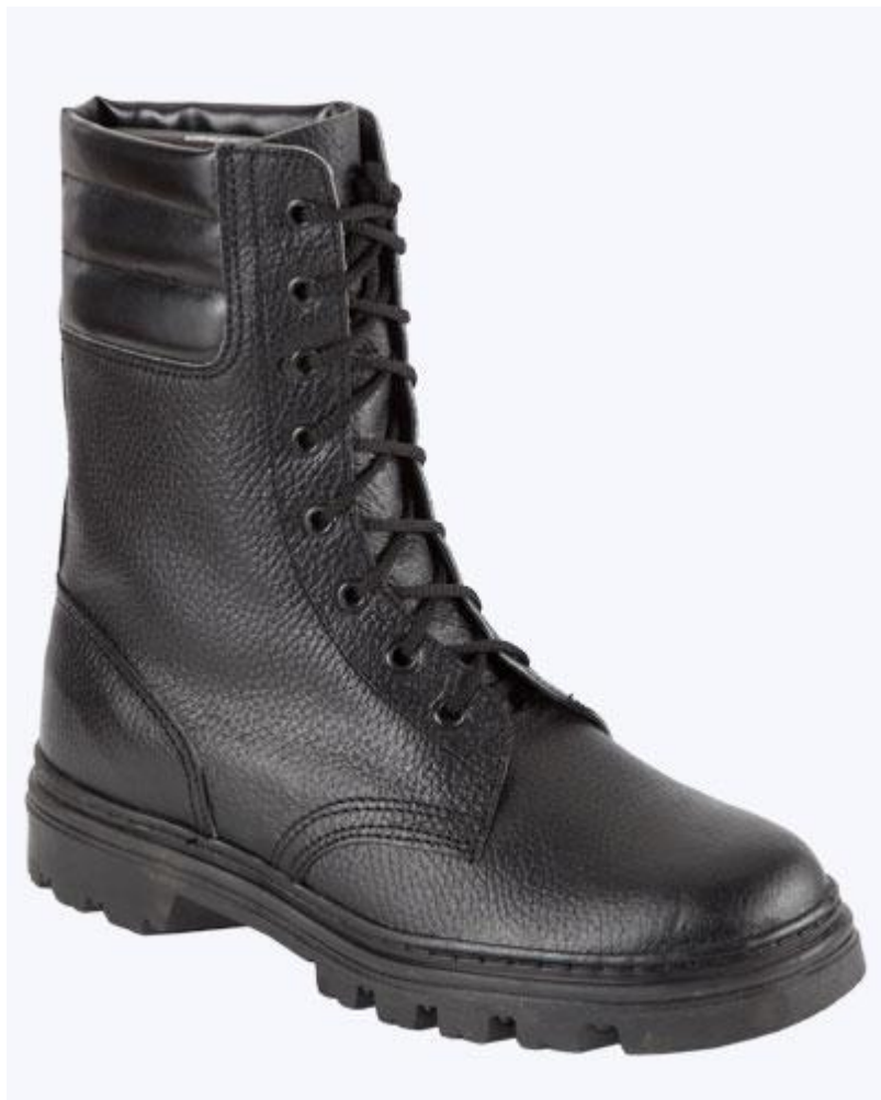
Ботинки Омон 2000 тг

Материал термостойкая кожа Подошва : П.У