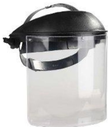
Щиток защитный 620 тг