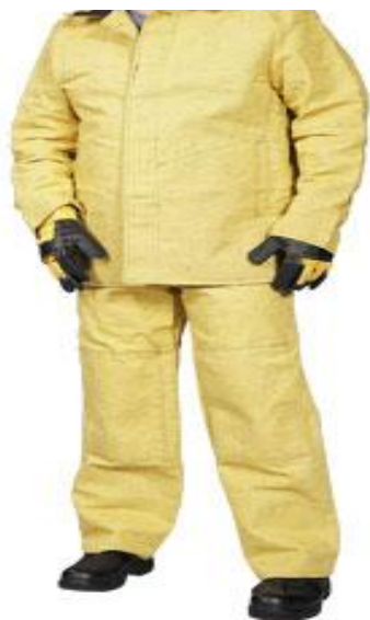
Костюм сварщика брезентовый