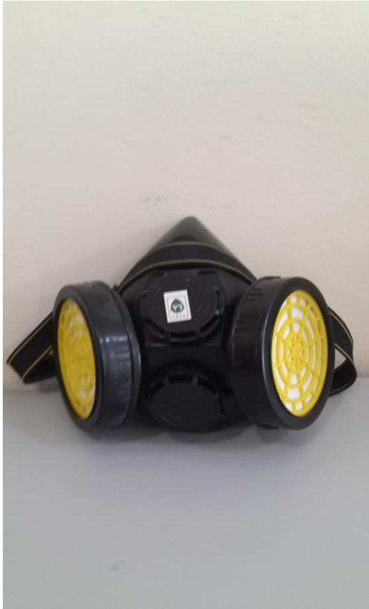
Респиратор химический NP 306