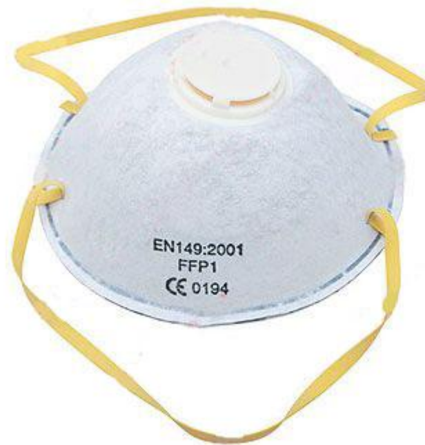
Респиратор ЛЕПЕСТОК 160 тг