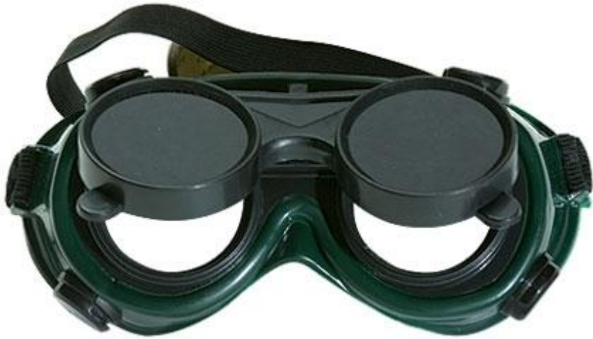
Очки Газо – Сварщика 435 тг